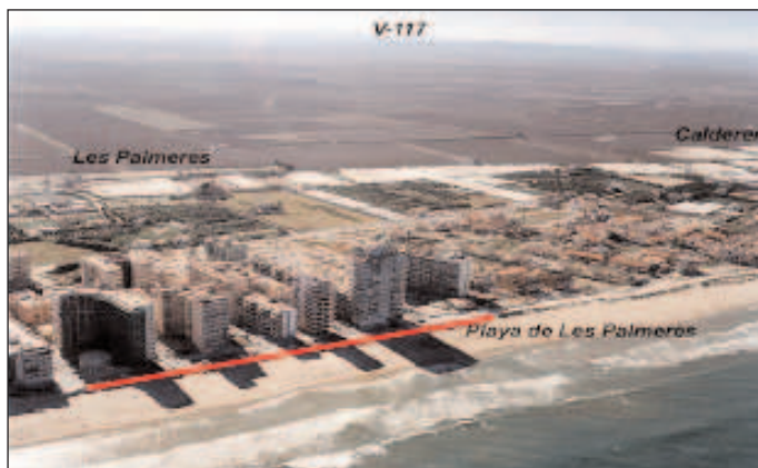
Tramo del paseo de la playa de Les Palmeres de Sueca que se va a remodelar

una inversión global de 1.354 millones de euros . Entre ellas destacan el Plan Global de Inundaciones de la Ribera del Júcar y la Adecuación Ambiental y Drenaje de la Cuenca del Poyo vertiente a la Albufera.