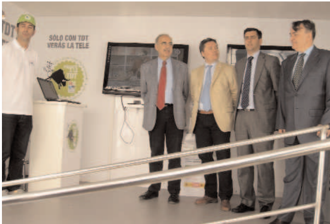
Camión que visitará los municipios para informar sobre la TDT

El apagón analógico se producirá el próximo 30 de junio en 7 municipios de la Comunitat Valenciana. En ellos, más del 83% de los hogares ya están adaptados para la TDT.