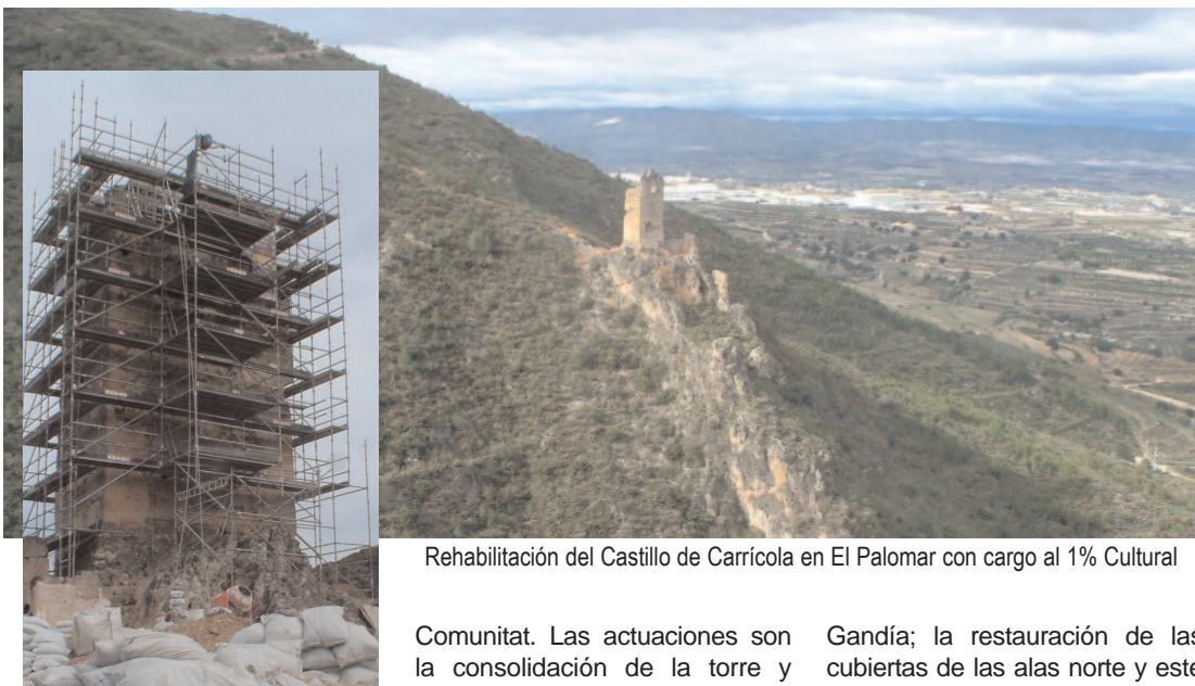
Rehabilitación del Castillo de Carrícola en El Palomar con cargo al 1% Cultural

Fomento destinará 4.097.696 euros a proyectos de recuperación de patrimonio histórico en la Comunitat, con cargo a los fondos que se generan para el 1% Cultural por la contratación de la obra pública del Ministerio. Con estos recursos se financiará en los próximos meses un total de 4 actuaciones de rehabilitación y recuperación de bienes, edificios y zonas de interés cultural en la