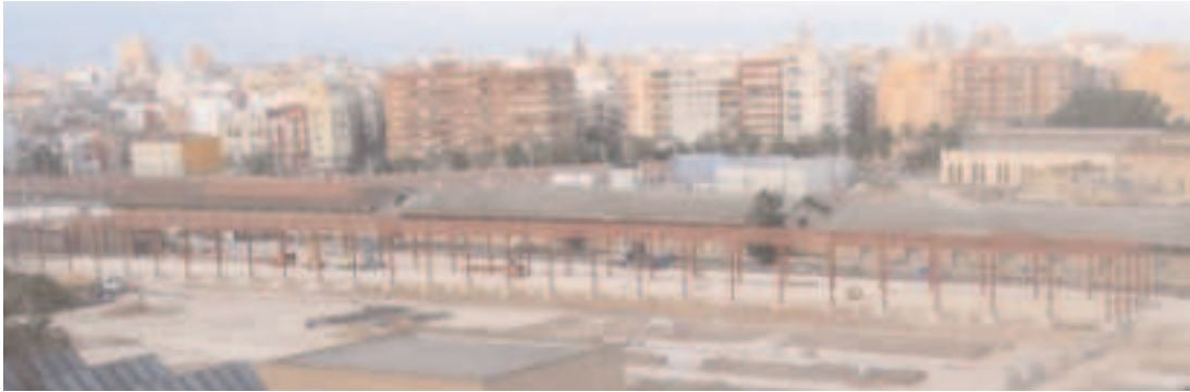
Obras de la estación provisional en marzo de 2009. www.valenciaparquecentral.com