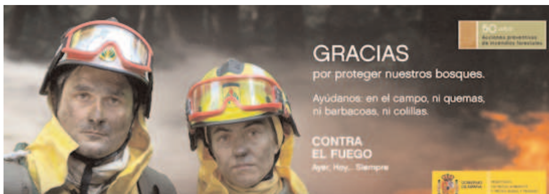
Anuncio publicitario de la Campaña de Prevención de Incendios Forestales. Año 2009

El Gobierno de España ha aprobado un Real Decreto-ley por el que se aprueban medidas urgentes para paliar los daños producidos por los incendios forestales y otras catástrofes naturales ocurridos en varias Comunidades Autónomas. Durante el verano se han producido un número importante de siniestros de especial virulencia tanto incendios forestales como fuertes tormentas. Estas catástrofes naturales han afectado tanto a las personas como a los bienes y las medidas de este RDL se aplicará a todos ellos, a los que hayan sido víctimas de incendios forestales y los que hayan sufrido por culpa de la situación meteorológica.