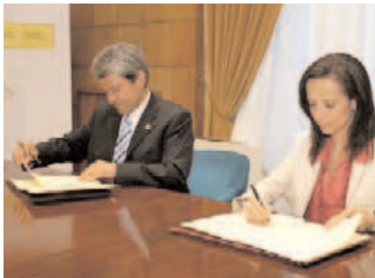
La Ministra y el Alcalde de Onda en el acto de firma

El Ministerio de Vivienda ha licitado las obras de ampliación del Museo de la Cerámica Manolo Safont de Onda (Castellón). El presupuesto total de la licitación es de 2.695.268,42€ . La intervención, que será cofinanciada por el Ministerio y el Ayuntamiento -en un 50% cada administración-, tiene por objeto construir un edificio anexo que albergará en su planta baja almacenes y talleres y en su primera planta una sala de exposiciones. Las obras tienen un plazo de ejecución previsto de 18 meses y se inscriben en el Programa de