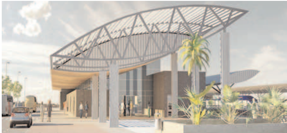
Infografía de la estación de Requena

La actuaciones realizadas por el Ministerio de Fomento durante el mes de agosto en la Comunitat han supuesto una inversión de 29.723.231,8€ . Las principales actuaciones se centran en la Línea de Alta Velocidad de Levante.