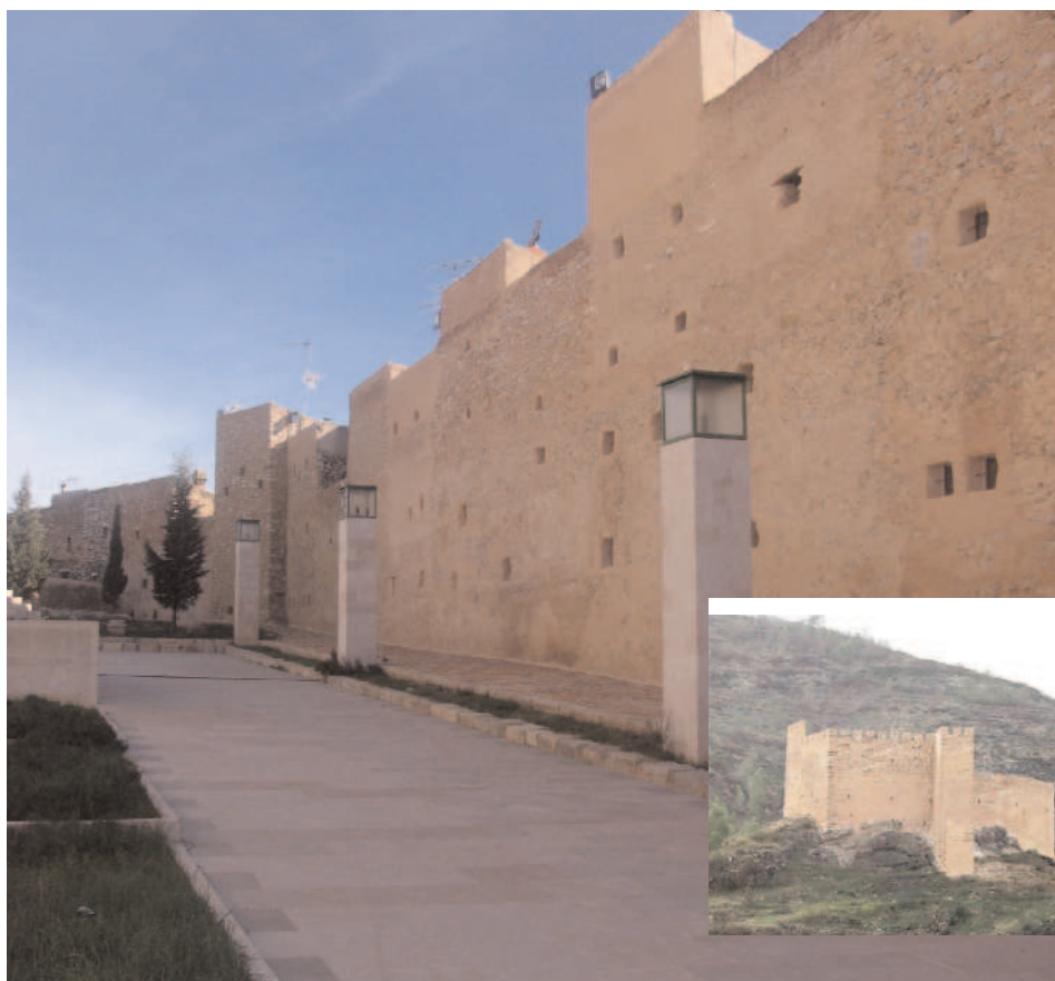
Murallas de Sant Mateu -a la izquierda- y Castillo de Gaibiel -abajo-.