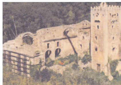
Mercado Central de Valencia y Monasterio de los Jerónimos de Alzira -a la izquierda-. Castillo de Alaquàs -bajo estas líneas-